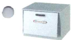
Forno Extra Médio Inox Tampa Inox Código: 9009