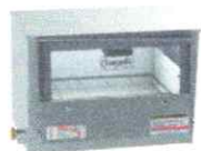
Forno Pequeno Inox Tampa Vidro Código: 9012

Para serem embutidos no fogão - Aço Inox 430 ou 304 - Opcionais tampas inox ou em vidro - Estrutura interna opcionais em chapa minimizada ou inox - Totalmente isolados em lâ de vidro - Kit de lâmpada é opcional - 6 tamanhos diferentes - Fornos Linha Ativo têm dimensões menores