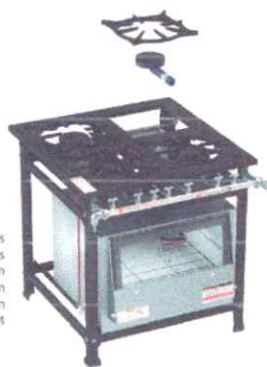
Fogão 4 Bocas 2 Q. Simples e 2 Q. Duplos Altura: 80,0 cm Profundidade: 88,5 cm Frente: 80,0 cm Código: 4013 / 9014

Perfil externo 70mm x Perfil interno 70mm