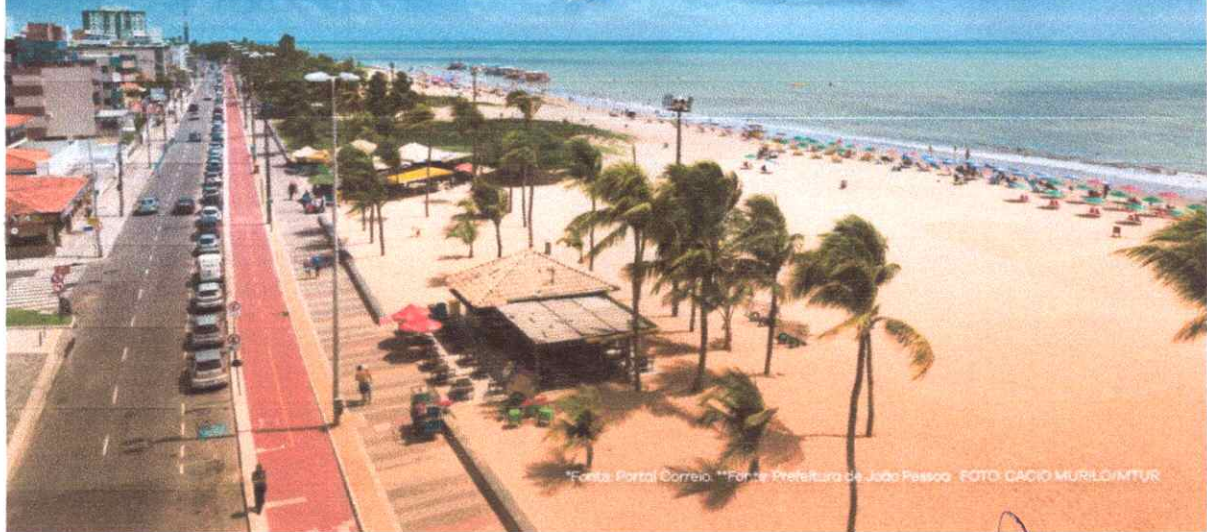
*Fonte: Portal Correio. **Fonte: Prefeitura de João Pessoa. FOTO: CACIO MURILLO/MTUR

João Pessoa/PB Av. Gal. Edson Ramalho, 1213 - sala 301 - Manaíra